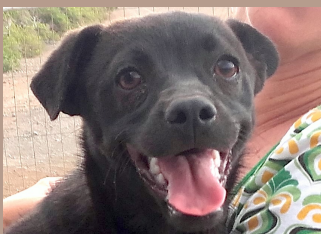
Anabel - Mischling Hündin (kastr.), 1 Jahr

Diese Tiere stehen stellvertretend für all unsere Vierbeiner, welche DRINGEND ein Zuhause suchen.