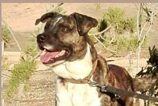
Toby - Bardinomischling Rüde (kastr.), 1,5 Jahre