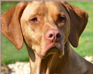
Madagaskar - Pointer-Mischling Rüde (kastr.), 7,5 Jahre