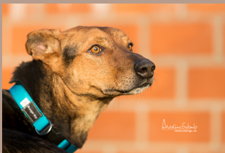
Bentayga - Mischling Rüde (kastr.), 4 Jahre

Diese Tiere stehen stellvertretend für all unsere Vierbeiner, welche DRINGEND ein Zuhause suchen.