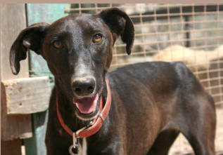
Palma - Podenca Hündin (kastr.), 3,5 Jahre