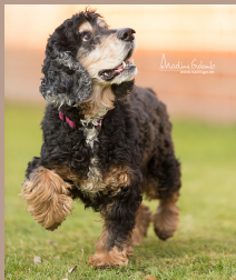
Nunki - Cocker Spaniel Rüde (kastr.), 11 Jahre

Unser Wunsch für 2017 - Körbchen gesucht